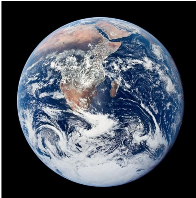
Abbildung 2: Die Erde, aufgenommen von der Crew der Apollo-17 Mission im Jahre 1972. Deutlich erkennbar sind die Antarktis, der afrikanische Kontinent, die Insel Madagaskar und die saudi-arabische Halbinsel. Die sehr stark reflektierenden Gebiete sind weiß, das sind Schnee- und Wolkenflächen. Die Wüsten sind deutlich heller als Waldgebiete oder Grasflächen. Sehr dunkel sind die Meere. Diese Helligkeiten entsprechen der Albedo der jeweiligen Flächen. (aus [2])

Wenn man ein Foto von der Erde betrachtet, aufgenommen von einem Satelliten oder, besser noch, von einer Raumsonde oder Rakete auf dem Weg zum Mond oder einem anderen Ort im Sonnensystem, ist alles, was man von der Erde sieht, reflektierte Strahlung (siehe Abb. 2). Auf einem solchen Bild sieht man sofort, welche Teile der Erde eine hohe und welche eine niedrige Albedo haben: Schnee- und Wolkenfelder haben eine hohe Albedo, ebenso Eisfelder; Wasser und Wälder haben eine sehr niedrige Albedo. Sand bzw. Wüste oder Steppen haben eine mittlere Albedo.