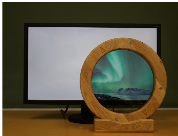
Abbildung 1.3: Entfernt man die vordere Polarisationsfilterfolie eines Flüssigkristallbildschirms erscheint nur noch ein weißes Bild, da die Lichtintensität der RGB-Subpixel nicht mehr durch Herausfiltern gesteuert wird. Erst wenn man durch einen (externen) Polarisationsfilter sieht, zeigt sich das eigentliche Bild.

Die beschriebenen Bildschirme lassen sich leicht in „geheime“ Bildschirme verwandeln. Wenn man die vordere Polarisationsfilterfolie entfernt, funktioniert die Steuerung der Lichtintensität der Subpixel nicht mehr: Das gesamte Licht der Hintergrundbeleuchtung passiert ungehindert die Flüssigkristallschicht und gelangt nach außen. Dadurch erscheinen alle Pixel weiß, und das eigentliche Bild wird unsichtbar. Der Besitzer weiß natürlich, was zu tun ist, um das eigentliche Bild zu sehen: Er sieht durch einen Polarisationsfilter mit der richtigen Orientierung (z.B. integriert in eine Brille), siehe Foto in Abbildung 1.3. Dreht er seinen Filter aus Versehen um 90^\circ , sieht er das Inverse des eigentlichen Bildes, denn dann ist die Intensität der Subpixel \propto \sin^2(\Delta\alpha) also \propto (1 - \cos^2(\Delta\alpha)) . Bemerkung: Aufgrund der doppelbrechenden Eigenschaft des Flüssigkristalls, kann man das Bild erahnen, wenn man schräg auf den Bildschirm schaut; aus einer Richtung sieht man das originale Bild und aus der gegenüberliegenden das invertierte.